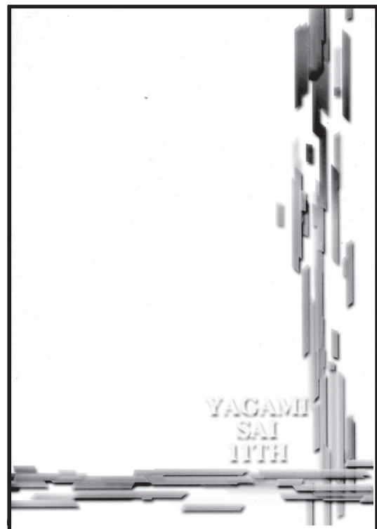
昨年のパンフレット表紙