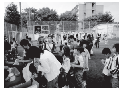
ご来場頂いた地域のお子様たち

理系発信、地域密着型、来場者参加型企画の多さなど、矢上祭は他の学園祭にはない魅力で溢れています。第12回を迎える今年の矢上祭のテーマは、「祭愛」。来場者、参加者、そして実行委員が祭を通してつながり、そしてその関わる全ての人たちにとって矢上祭が愛される存在となるように。そんな願いが込められています。