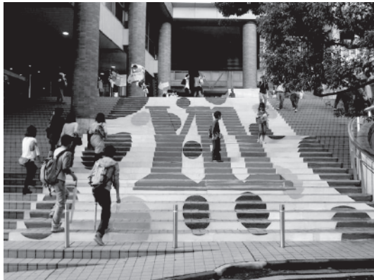
矢上キャンパス入り口