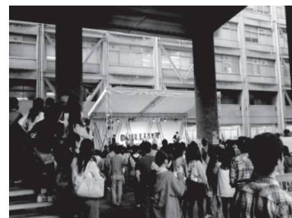
にぎわうステージ周辺