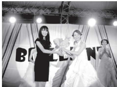
ミス・コンテスト

例) 2.4×0.9mスペース+パンフレット1項or物品協賛の場合 スポンサー料：¥150,000