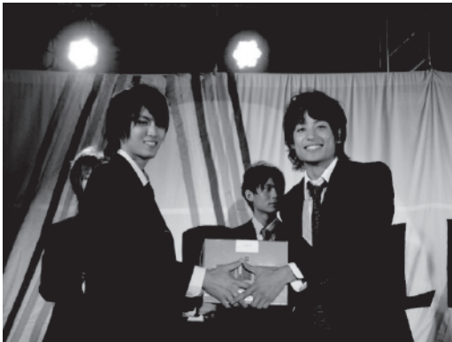
ミスター・コンテストでの商品授与